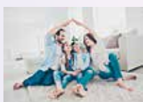
Отдел опеки и попечительства Понедельник с 10:00 до 12:00 Четверг с 15:00 до 17:00